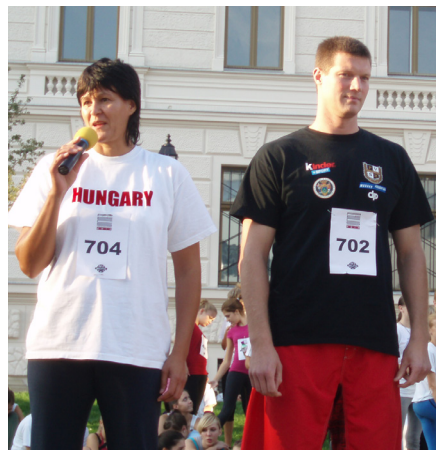
Vári Attila olimpiai bajnok vízilabdázó