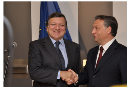
Orbán Viktor és José Manuel Barroso