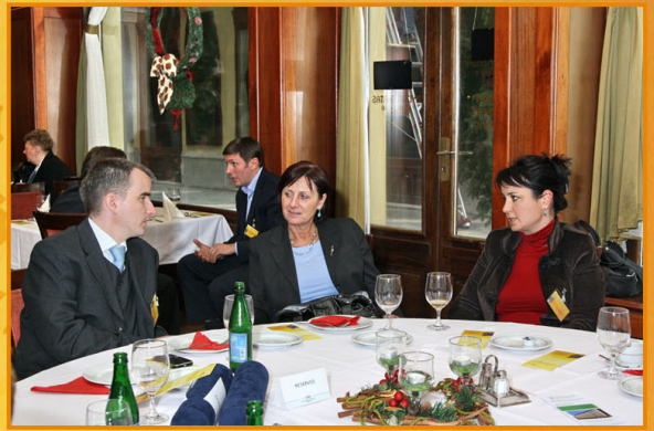
Bitterbo, 1367. sz. sz. sz.